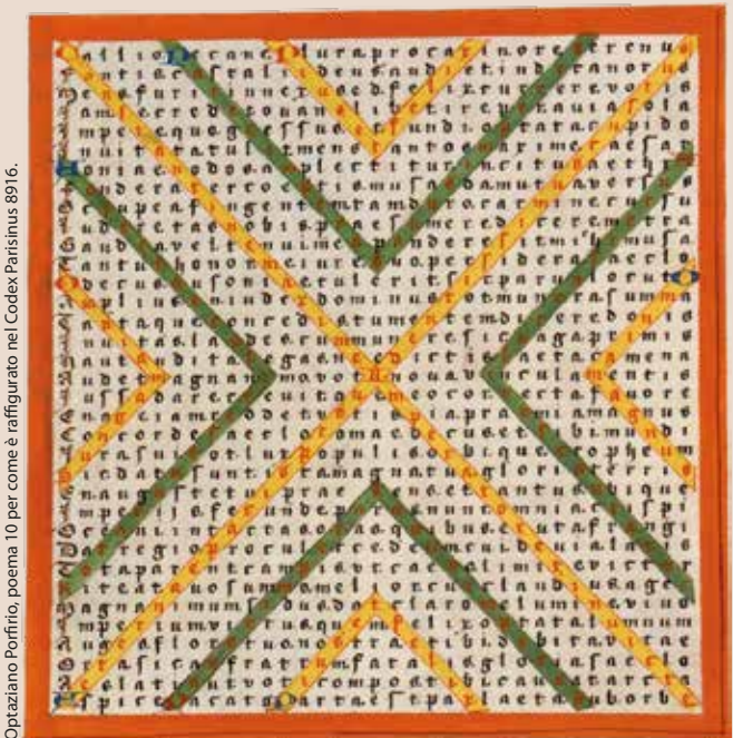
Optaziano Porfirio, poema 10 per come è raffigurato nel Codex Parisinus 8916.